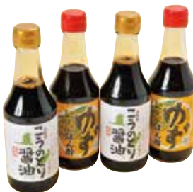
■大徳醤油 醤油・ポン酢セット 2,500円