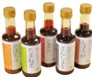
■大徳醤油 有機ドレッシング 5,000円