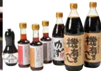
■大徳醤油 ふると醤油セット 10,000円