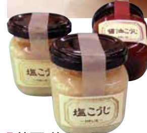
■花房 麴セット [塩麴][醤油麴][甘麴]のセット 2,160円 3本セット [上記3本セット]+[もろゾエノ][するめ麴漬][もろみみそ]のセット 4,158円 6本セット