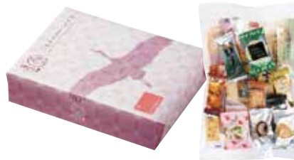
■げんぶ堂 和みの里 1,200円