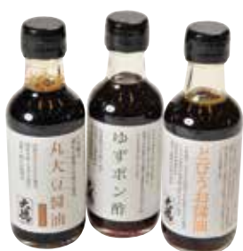
■大徳醤油 ミニ醤油セット 1,500円