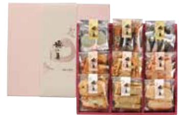
■げんぶ堂 穂の集い(ほのつどい) 2,000円 2,500円 3,500円