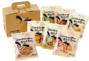
■げんぶ堂 こうのとりの郷セット (簡易包装) 1,100円