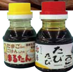
■花房 まるたん・たびたびセット [卵かけごはん][おさしみ専用]の醤油セット 1,300円